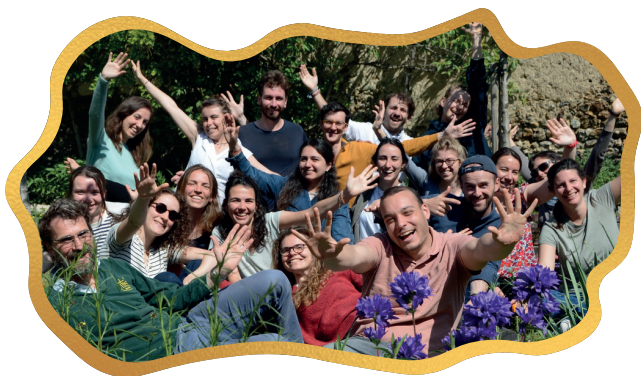
EVO longs Paris

Le 1er février 2026, nous commencerons à célébrer le Bicentenaire de la congrégation du Cénacle, soit 200 ans de vie et de partage de notre mission . Nous avons prévu des activités pour marquer cette année spéciale. Les équipes de la province organiseront plusieurs événements autour de Lalouvesc (lieu de naissance du Cénacle) : un pèlerinage pour les jeunes en Ardèche, une semaine de prière pour les pèlerins et une journée internationale de célébration le 22 août dans la basilique et le village. Des initiatives locales seront également proposées dans les différentes régions de la province. Communiquer qui nous sommes en tant que congrégation est un élément essentiel de nos projets pour cette année. En effet, nous voulons partager avec les autres notre conviction que la mission du Cénacle est toujours d'actualité dans le monde d'aujourd'hui . Nous avons la responsabilité de transmettre l'héritage de la congrégation, de partager le trésor que nous avons reçu avec les gens de notre temps . Pour cela, nous devons exprimer notre charisme et notre mission de manière nouvelle afin de communiquer notre mission à de nouveaux publics.